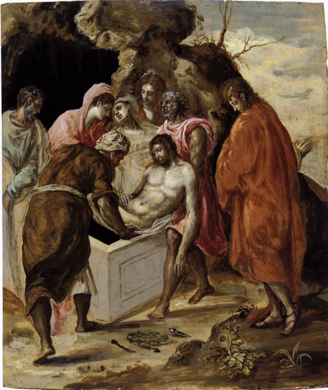
Η Ταφή, 1569, Αθήνα, Εθνική Πινακοθήκη

«Χριστός Ανέστη»: Η Ανάσταση του Χριστού εν μέσω δόξης.