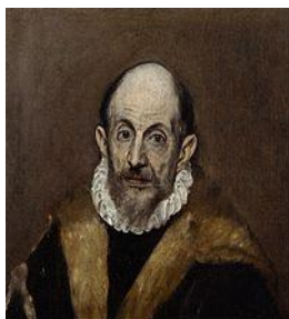
Δομήνικος Θεοτοκόπουλος (El Greco)

Το σώμα Του τυλιγμένο σε εκτυφλωτικό φως... ένα φως που είναι αδύνατο να αντέξουν οι φρουροί στρατιώτες.