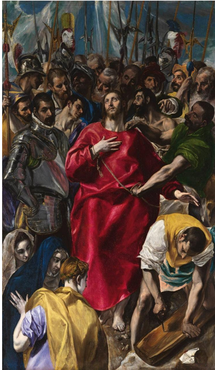
Ecce homo , 1577-79, Τολέδο, καθεδρικός ναός