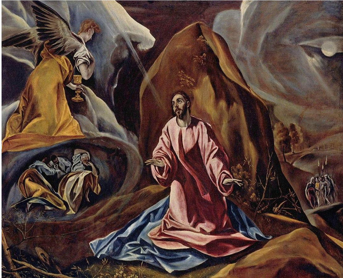
Προσευχή στον Κήπο των Ελαιών, 1590, Λονδίνο, Εθνική Πινακοθήκη