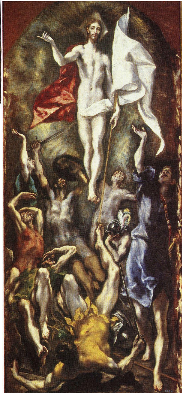
Ανάσταση, 1597-1600, Μαδρίτη, Μουσείο του Πράδο

Μετά την αποκαθήλωση το σώμα του Ιησού ενταφιάζεται. Σε λίγο θα καταφτάσουν στρατιώτες ως φρουροί του Πανάγιου Τάφου. Οι Αρχιερείς το απαίτησαν από τον Πιλάτο, φοβούμενοι μην και οι μαθητές κλέψουν το Άγιο Σώμα και ισχυριστούν ότι αναστήθηκε...